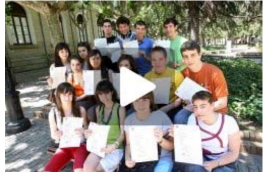
Un grupo de estudiantes de Sagasta muestra los resultados de Selectividad tras recibir ayer las notas.

Por años, en el 2005 pasó la prueba el 95,21% de los presentados; en el 2006, el 94,25%; en el 2007, el 91,84%; y durante el pasado curso aprobó el 95,06%. En esta ocasión, la cifra del 91,6% supone un retroceso de 3,5 puntos porcentuales.